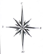
СХЕМА ПЛАНИРОВОЧНОЙ ОРГАНИЗАЦИИ ЗЕМЕЛЬНОГО УЧАСТКА ПОД РАЗМЕЩЕНИЕ ОФИСНОГО ЗДАНИЯ СО ВСТРОЕННЫМ МАГАЗИНОМ ПО АДРЕСУ: Ростовская обл., Аксайский район, г. Аксай, ул. Луначарского, 29